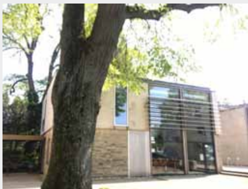
Das wird unser neues Gemeindehaus

Aus den letzten Gemeindebriefen und anderen Medien haben Sie sicher alle schon von Veränderungen in der Kirche, im Kirchenkreis und auch in unserer Gemeinde erfahren. Diese hängen mit den zurückgehenden Mitgliederzahlen zusammen, aber auch die Inflation, die Energiekrise und der Fachkräftemangel spielen eine Rolle. Kirche